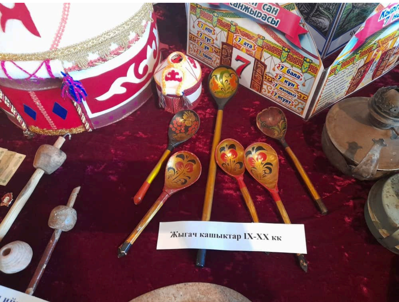
Жыгач кашыктар ІХ-XX кк