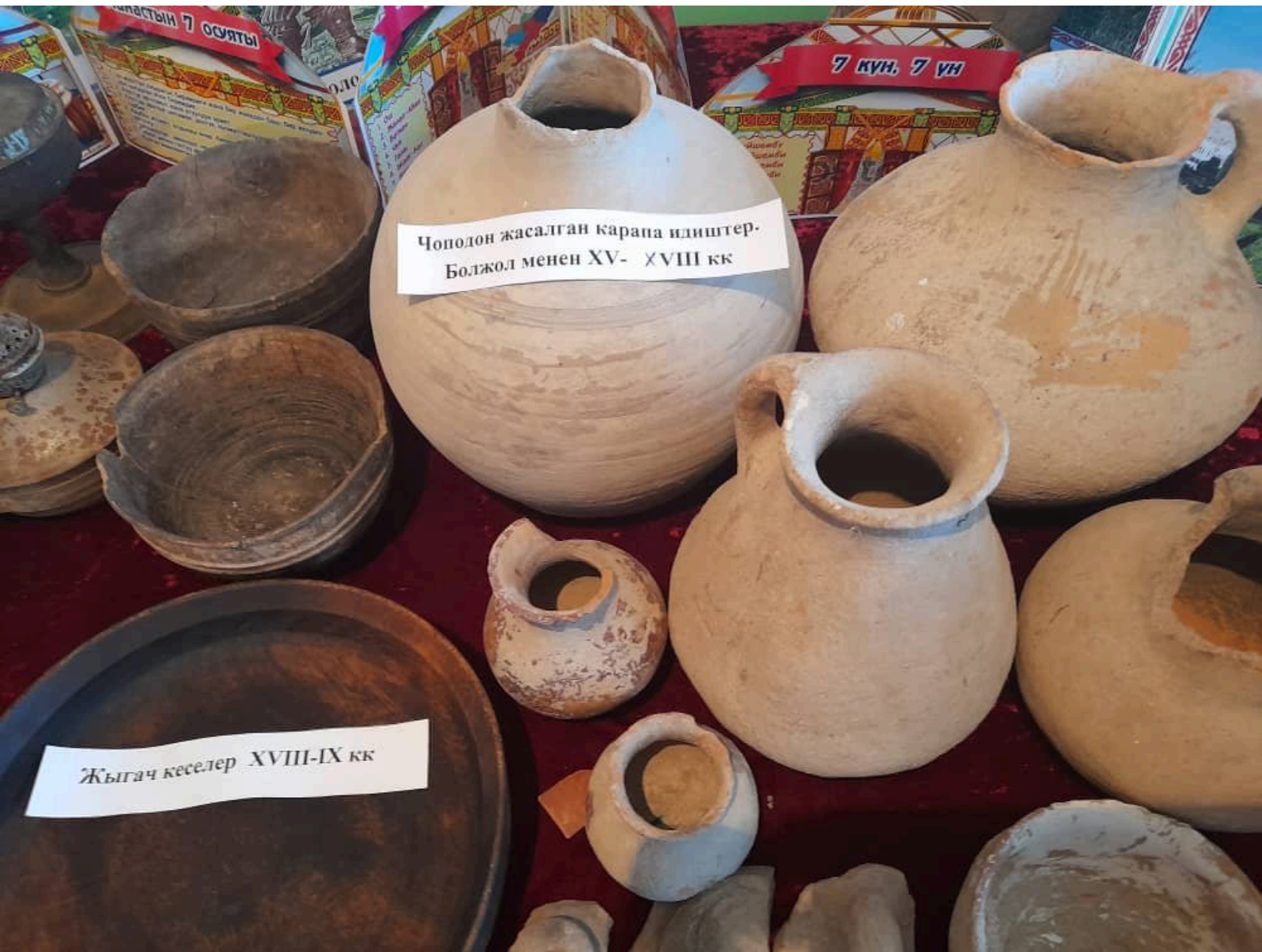
Чополон жасалган карапа идиштер. Болжол менен XV- XVIII кк